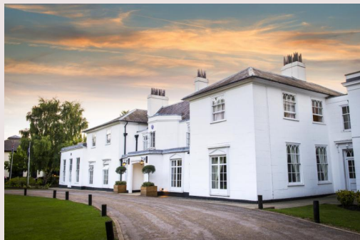
Månelogens hovedsæde i England.